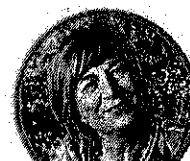
GIOVANNA MARIA BURRELLI SCUOLA PRIMARIA