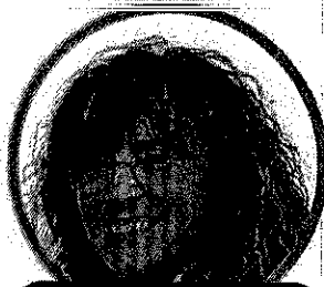
MARIANGELA MAPELLI SCUOLA PRIMARIA