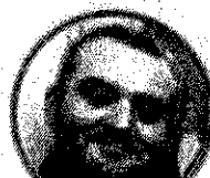
ROBERTO ZOLLO SCUOLA PRIMARIA