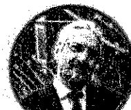
MASSIMO TAVOLA SECONDARIA DI PRIMO GRADO