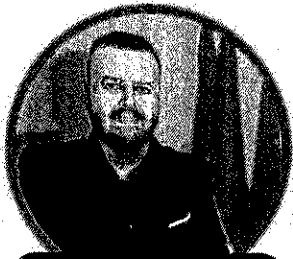
GIUSEPPE FAVILLA SECONDARIA DI SECONDO GRADO

DOCENTI, ATA, INSEGNANTI DI RELIGIONE PER LA SCUOLA